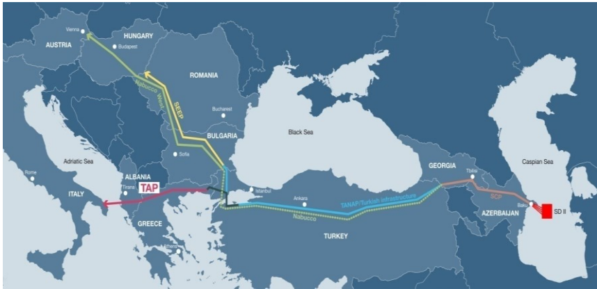
Harita 4. TAP Boru Hattı